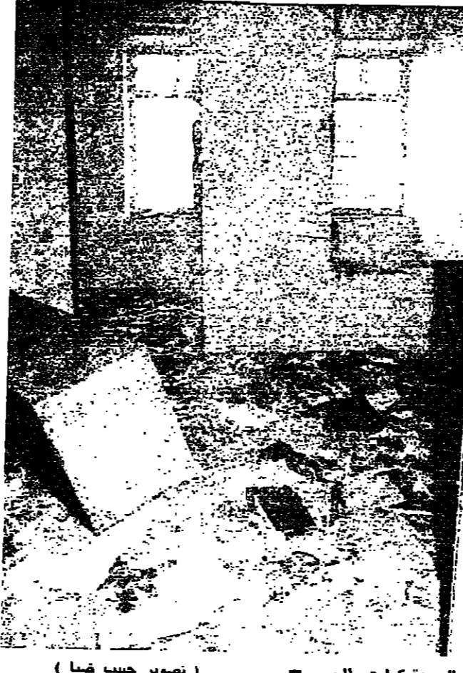
مكتب الجريدة كما هو اليوم

دائرة هو السيد كامل البيطل. الجريدة الرسمية في لبنان بالتحديد، هناك اوراق تخرج الى انها بلغت من العمر السنة الرابعة بعد المئة، اي انها صدرت في العام ١٨٧٢، لكن اول مجموعة مجلدة للجريدة الرسمية كتبت انما صدرت في العام ١٩١٨، بعد دخول الفرنسيين الى لبنان، باللغتين العربية والفرنسية. وليس ثمة مرجع مؤرخ وثابت من تاريخ الجريدة الرسمية في لبنان، حتى ان القانون الصادر عام ١٩٢٥ الذي يقضي بالترامية نشر القوانين والمراسيم بالجريدة الرسمية، لتصبح نافذة المفعول، اورد كلمة «الجريدة الرسمية» دون ان يتحدث عن ميزاتها كطبوعة رسمية. في الأسبوع واستمرت الجريدة الرسمية في الصدور بمعدل مرة في الأسبوع، حتى ١٥ سنة خلت، حيث صدر قرار باصدارها مرتين في الأسبوع